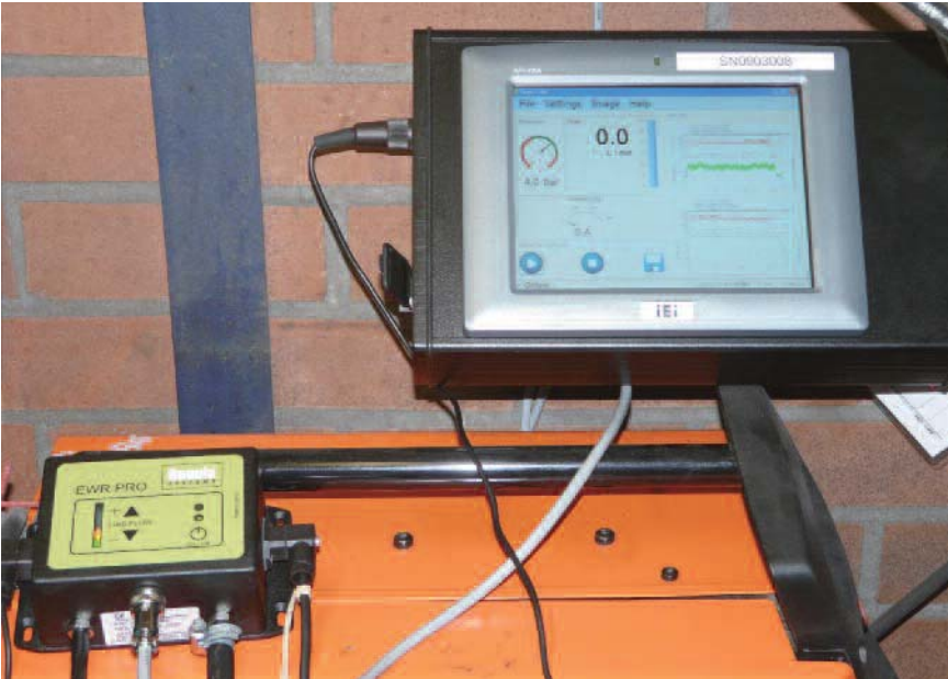
◀ Bild 1. Die Installation des Systems mit Monitor und Schutzgasregulator gestaltet sich einfach.

sehr geringe Veränderungen des Schweißstroms. Der Gasfluss wird auch bei kurzen Unterbrechungen während eines Schweißzyklus unter Beachtung einer angepassten Gasnachströmzeit ganz unterbrochen.